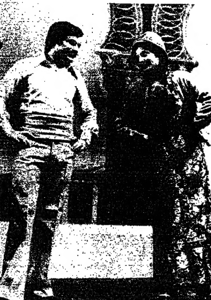
أيزا (سولي القزيب) وستادالوجية أنطوان كراج في « بنيت الجبل »